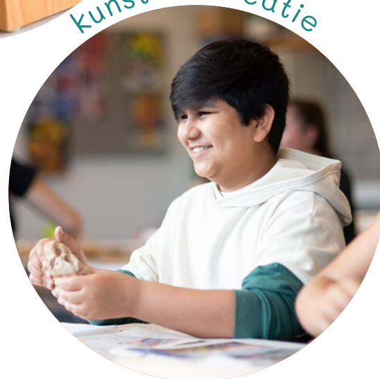
kunst en creatie