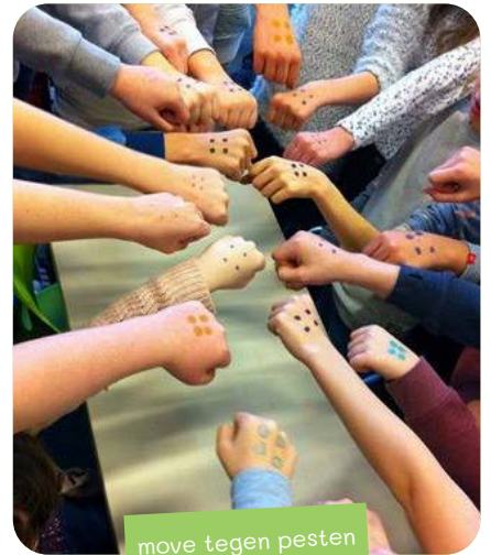
move tegen pesten